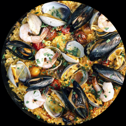
Premier vendredi du mois Paëlla à Valenciennne 21.50